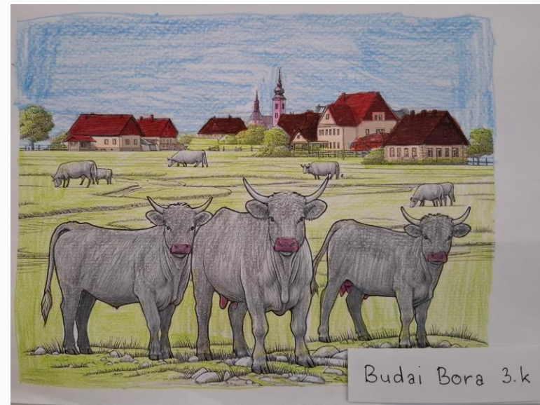
Budai Bora 3.k