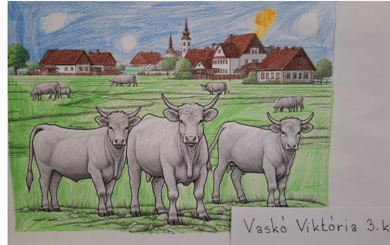
Vaskó Viktória 3.k